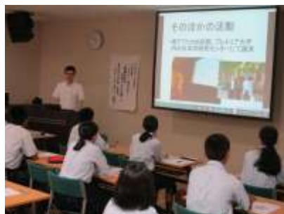
4、5年 高大連携模擬授業