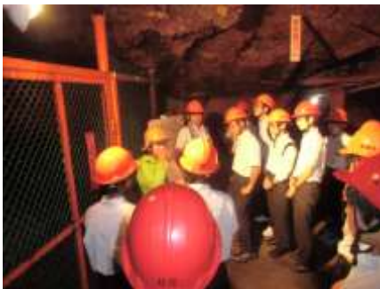
3年 学習合宿・平和学習