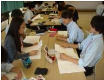
4年 アメリカ事前研修